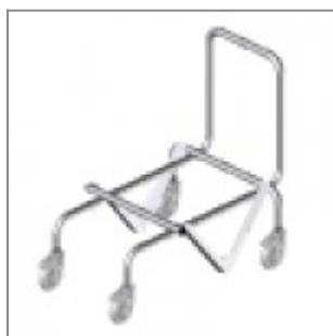
Carrello porta sedie in tondino verniciato nero