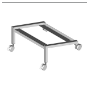
Carrello portasedie ca + ec + mk