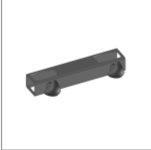
Aggancio anteriore sedie Make Up nero