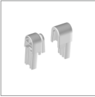
Aggancio maschio+femmina Make Up nero