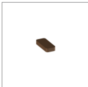
Feltrino c/adesivo 10x24mm sp.4mm